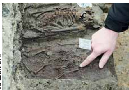
Jedním z překvapivých nálezů byla zachovalá kostička dítěte, vysoká jen asi třicet centimetrů.

Všechny ostatky z pohřebiště čeká vyvednutí a důkladný antropologický průzkum. Z něj pak vyplyne například to, jací lidé zde ještě před založením královského města žili, jak vysocí byli, jaké nemoci je sužovaly či nakolik byli mezi sebou pokrevně spřízněni. Konkrétní osudy jednotlivých nebožtíků však už ani sebelepší antropologická analýza neobjasní. (mf)