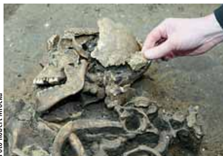
Archeology pod povrchem země čekal i nález kostry člověka, kterému někdo ve 12. století setnul hlavu.

lení půdorysu kaple berou za své. Stavba byla totiž zřejmě složitější a větší, než se zprvu zdálo, a dokonce možná souvisí se zdí, které před dvaceti lety našel při jiném průzkumu na ploše o kus dál archeolog Josef Bláha. Na kapli, o níž se hovoří v písemných pramenech, by však už stavba měla neobvykle složitý půdorys.